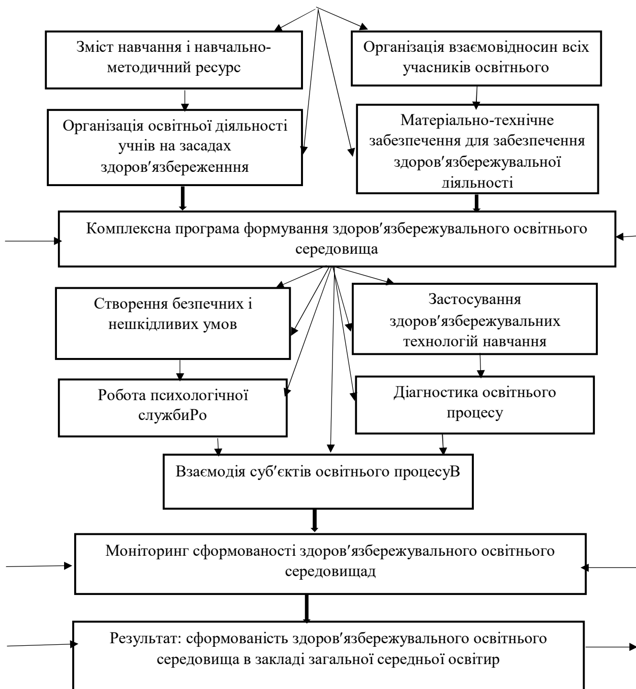
Рис.2.1. Модель формування здоров'язбережувального освітнього середовища в закладі загальної середньої освіти

– матеріально-технічне забезпечення для організації здоров'язбережувальної діяльності закладу освіти;