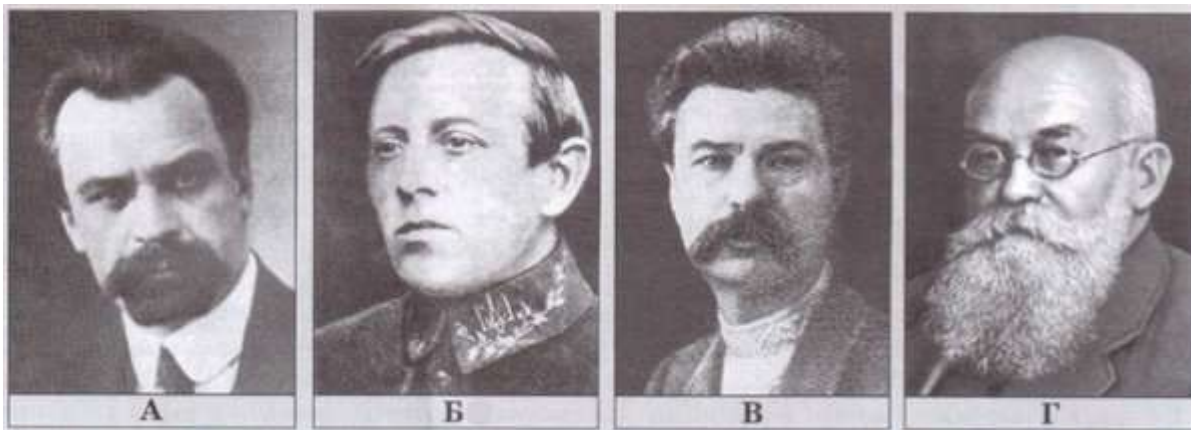
Рис. 2 Прочитайте фрагмент історичного документа та визначте, хто з діячів, зображених на фото, очолював делегацію Української Центральної Ради до Петрограда?

Рис. 1. Територію якого державного утворення позначено на карті жирною лінією?