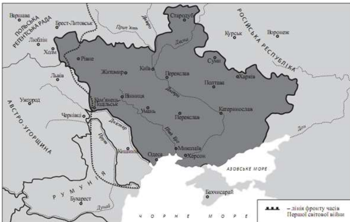
Рис. 1. Територію якого державного утворення позначено на карті жирною лінією?