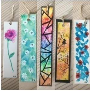
Закладка (смужка паперу)