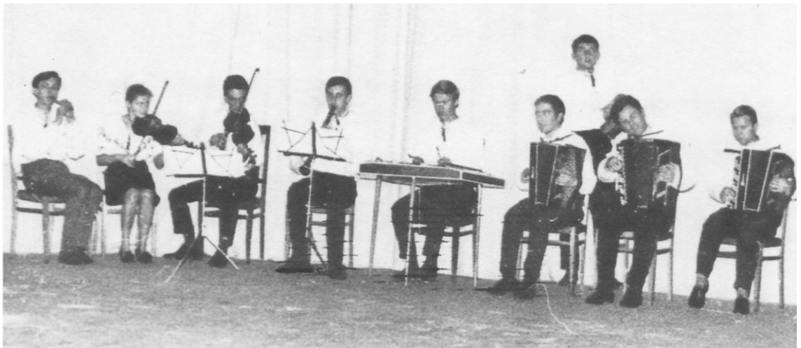
Оркестр народних інструментів танцювального ансамблю «Горлиця» Кам'янець-Подільського державного педагогічного інституту імені В. П. Затонського.