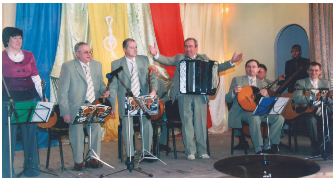
Ансамбль народних інструментів «Славичі» (худ. кер. – В. Общанський).