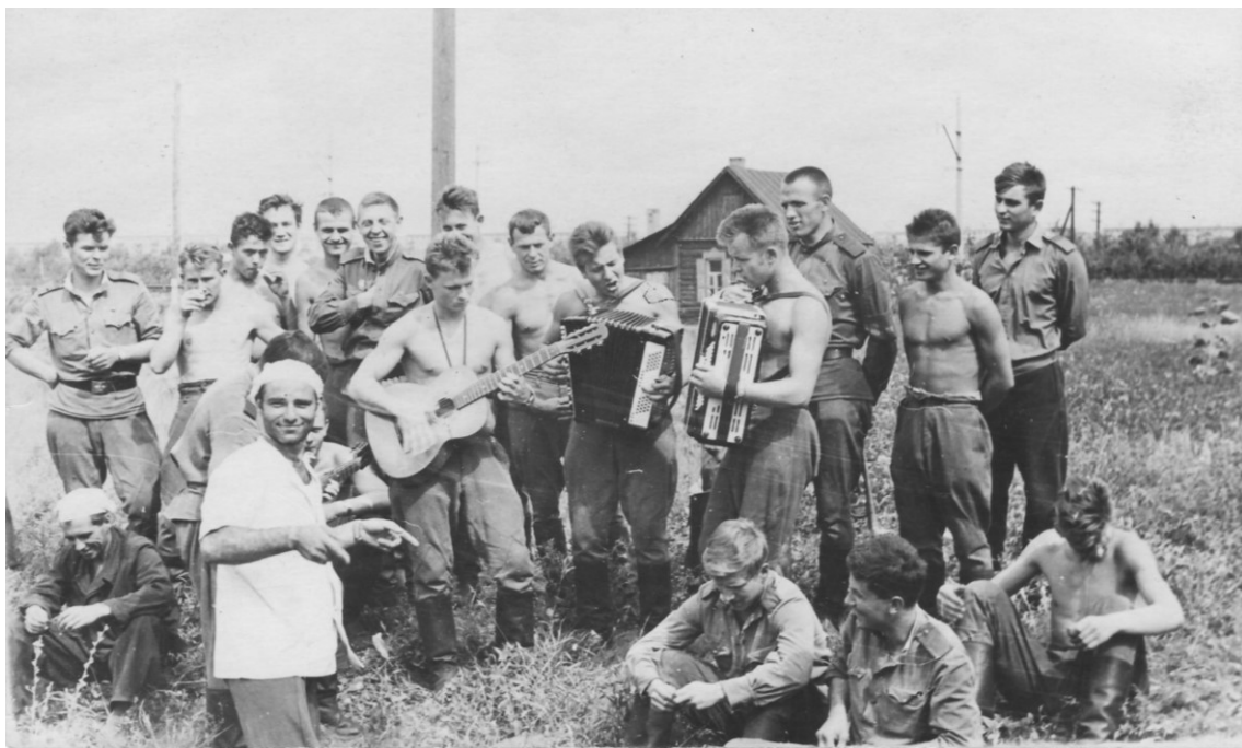
Дорога на службу в Забайкальський військовий округ (м. Старокостянтинів, Україна – Читинська обл., Росія). Друга ескадрилья авіаційного полку 1966 р.