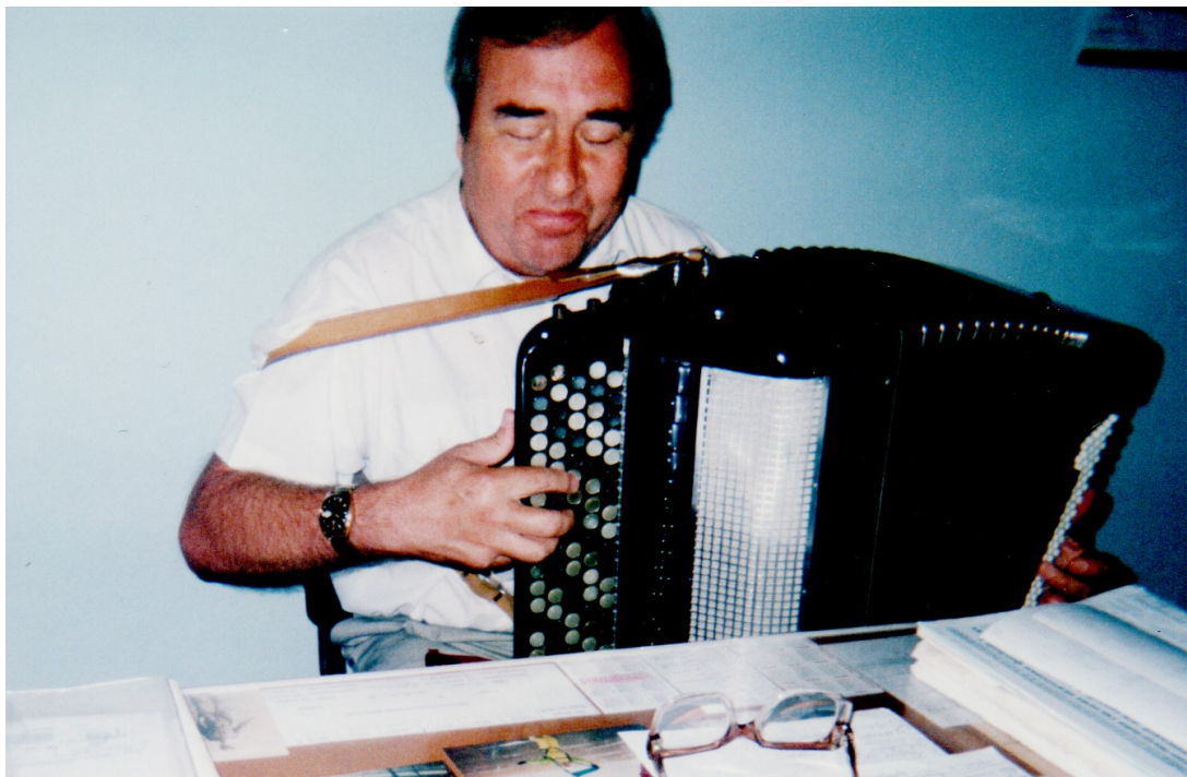
Виконання «Сонати» № 2 М. Чайкіна.