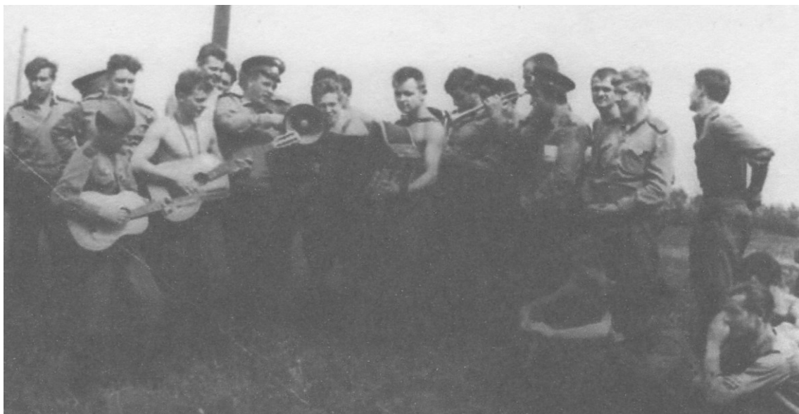
Далека дорога на військову службу, 1966 р.