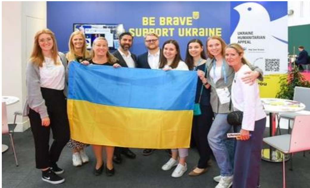
Рис 2.3 Україна на міжнародному форумі туризму IMEX Frankfurt

закликають відвідати іноземних туристів, щоб на власні очі побачити наслідки війни, відчутти силу і міць українців та підтримати економіку країни [10].