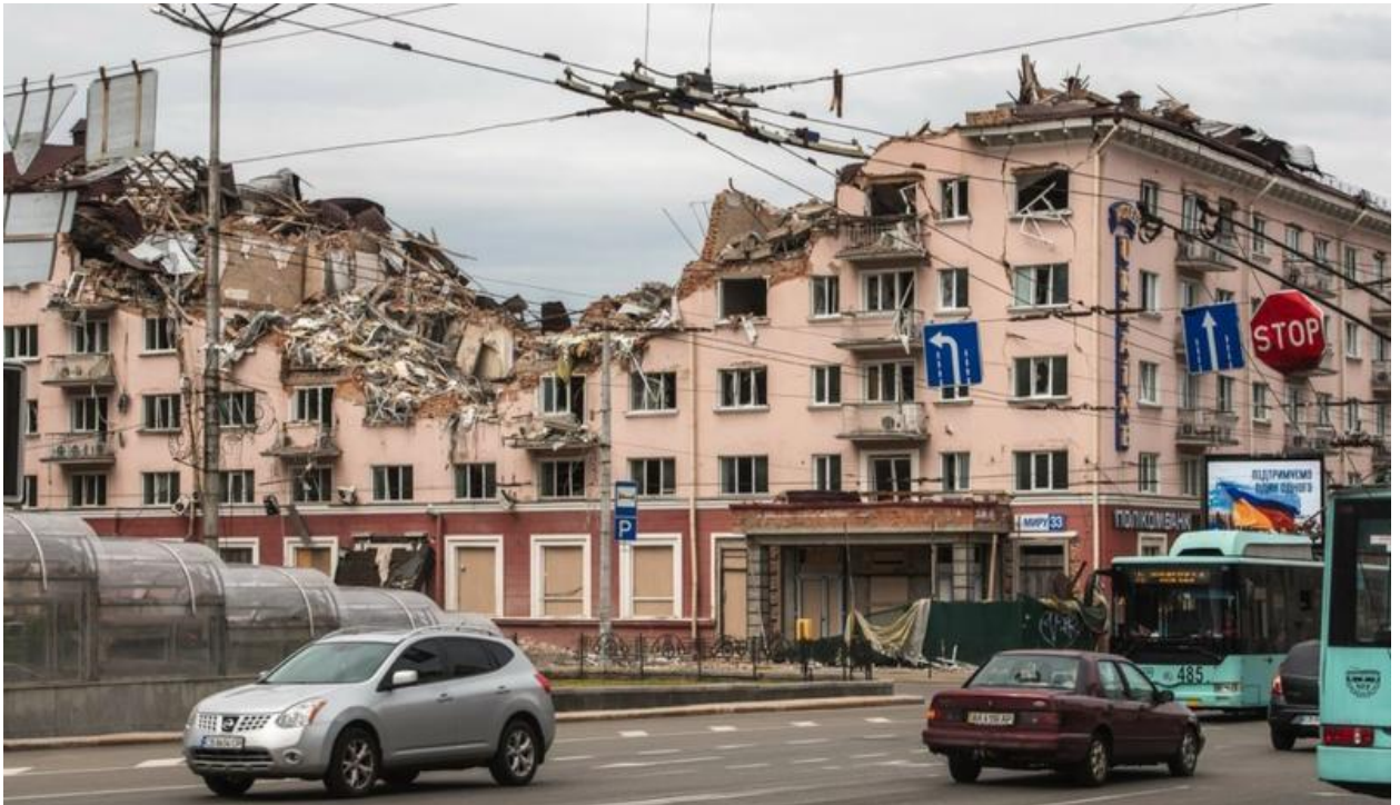
Рис.2.2 Наслідки удару російської ракети по готелю «Україна» в місті Чернігів

Згідно висновків експертів Європейської туристичної компанії воєнна агресія росії проти України суттєво вплинула на авіасполучення з країнами Європи. Небо нашої держави вже близько трьох років від початку повномасштабного вторгнення повністю закрито для польотів цивільної авіації. Заборона польотів над територією України спонукала туристичних операторів шукати альтернативні туристичні шляхи. Авіап перевезення українських туристів під час війни здійснюється через такі країни Євросоюзу, як Молдова, Польща, Словенія, Латвія, Чехія, Фінляндія тощо.