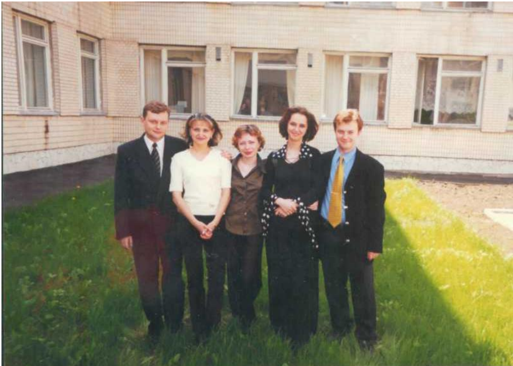
Молоді спеціалісти Хмельницький гуманітарно-педагогічний інститут, 2000 р.