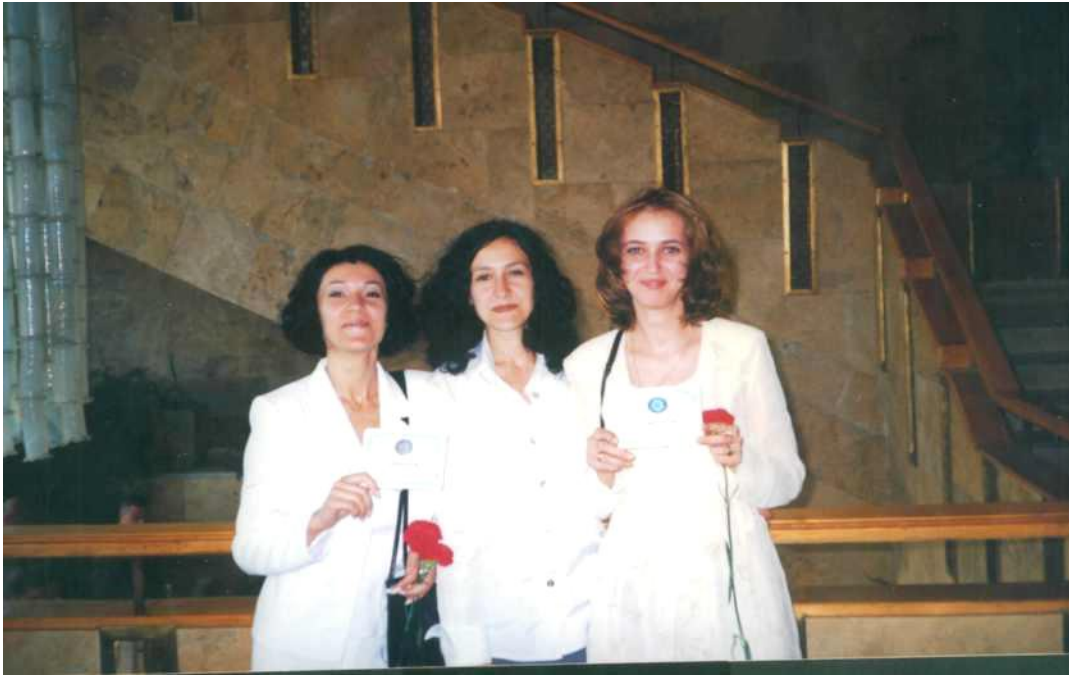
Випускниця Хмельницького інституту регіонального управління та права, 2000 р.