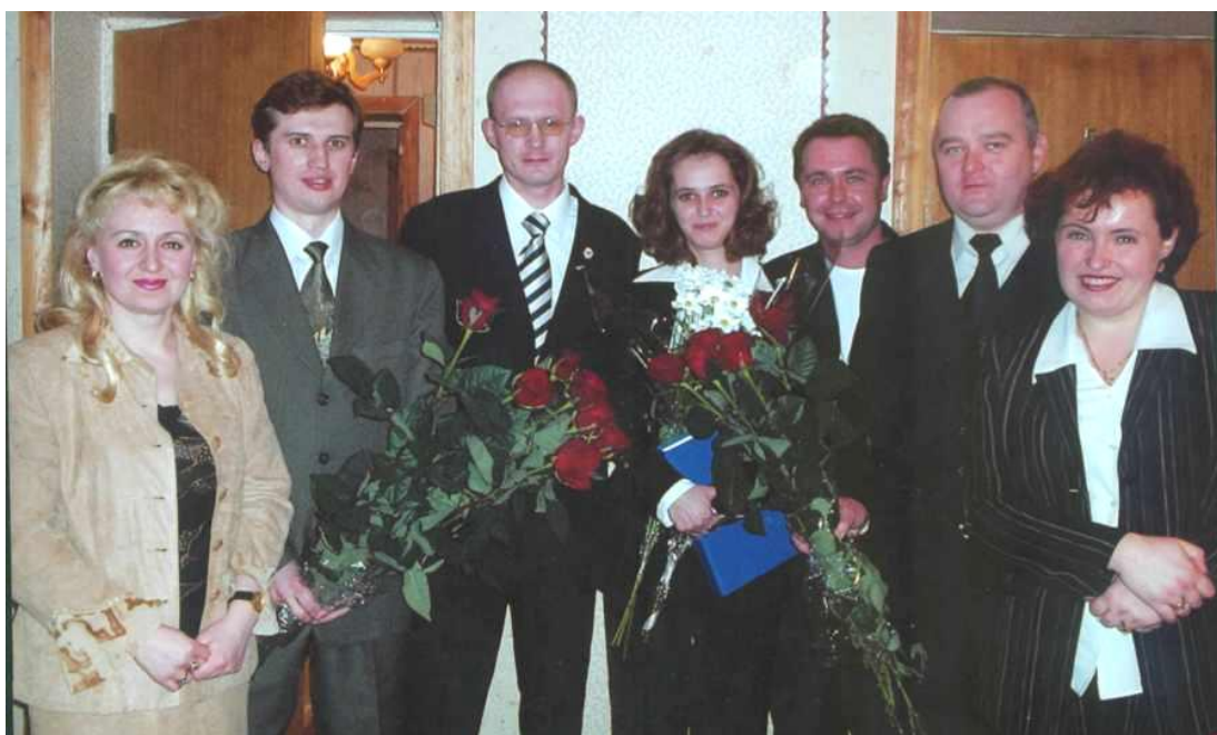
Привітання колег із захистом 31.03.2004 р.