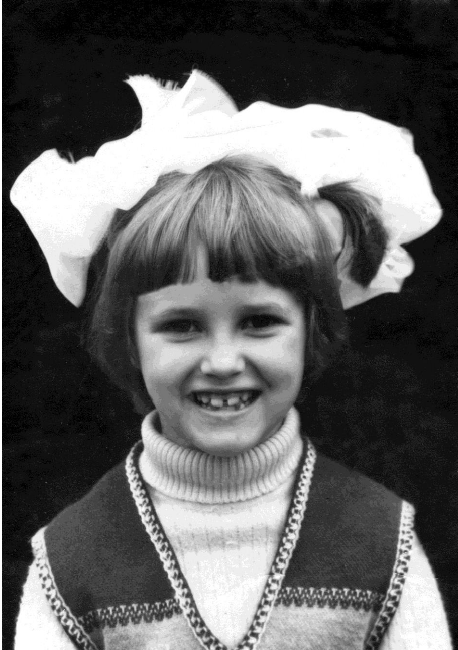
Дівча з розумними очима