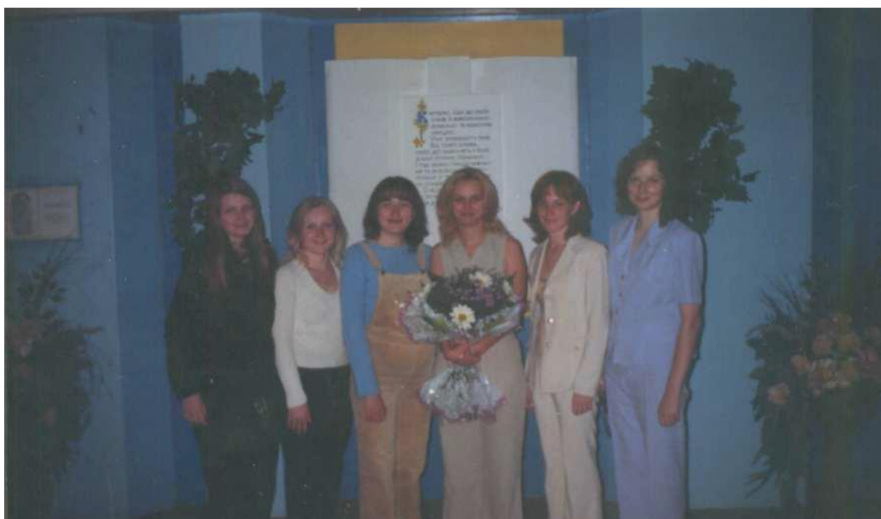
Захист магістерських робіт червень, 2005 р.