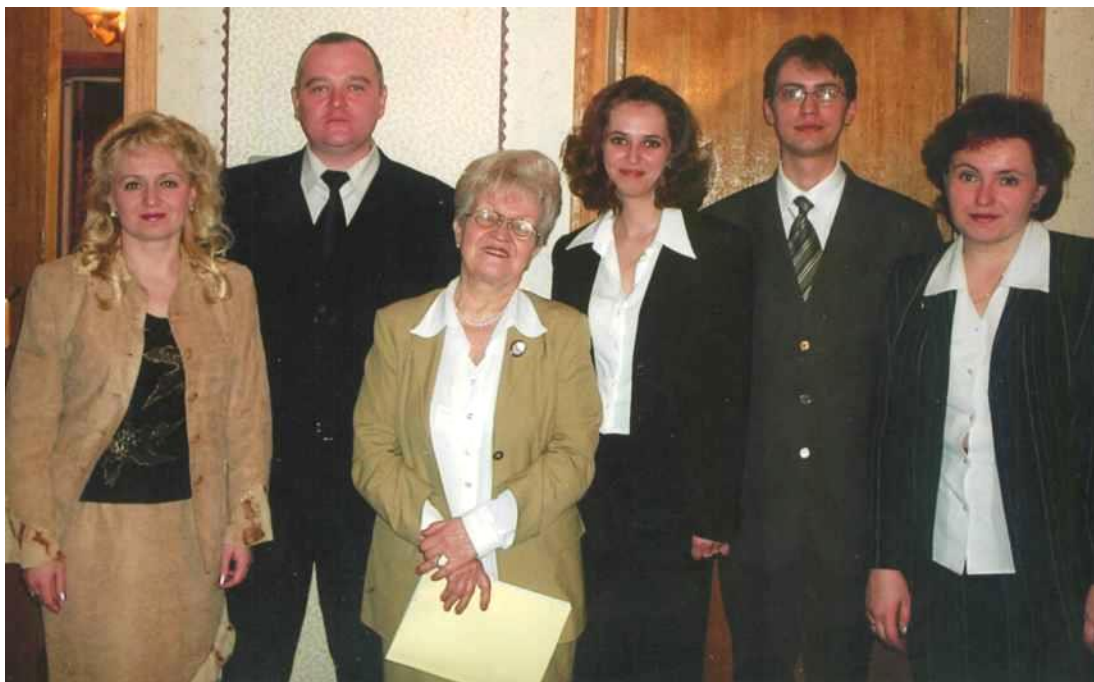
Успішний захист дисертаційного дослідження 31.03.2004 р.