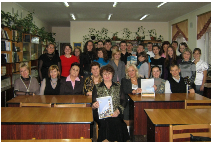
Презентація літературного альманаху «На крилах мрій». 2009 р.