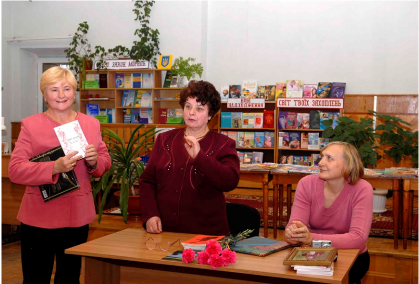
В гостях у центральній міській бібліотеці