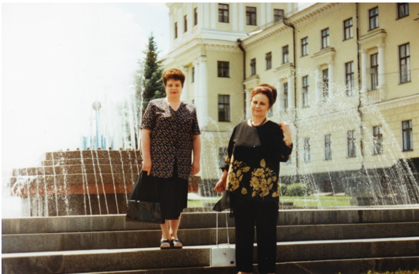
Прогулянка до фонтанів. 2007 р.