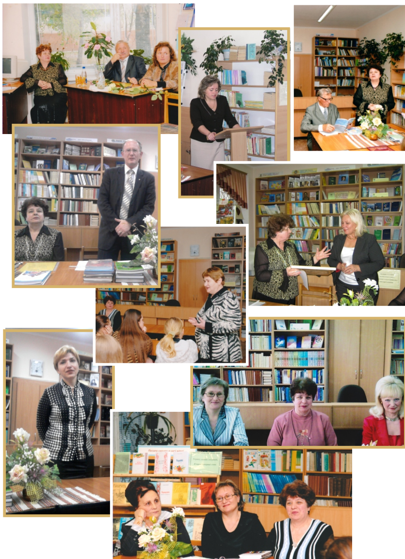
На зустрічах студентів з викладачами-науковцями ХГПА із циклу заходів «Взірці педагогічної ниви»