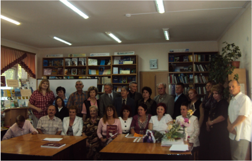
Презентація збірки вибраних творів літераторів Поділля «Заповідаємо вам любов». 2011 р.