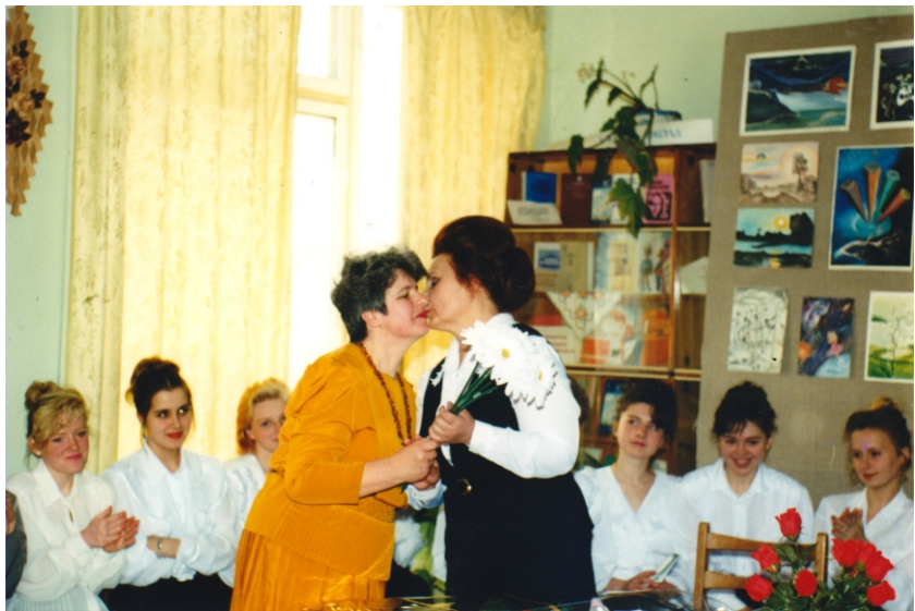
Презентація збірки «Голосом серця» в літературно-мистецькому клубі «Діалог». 1996 р.