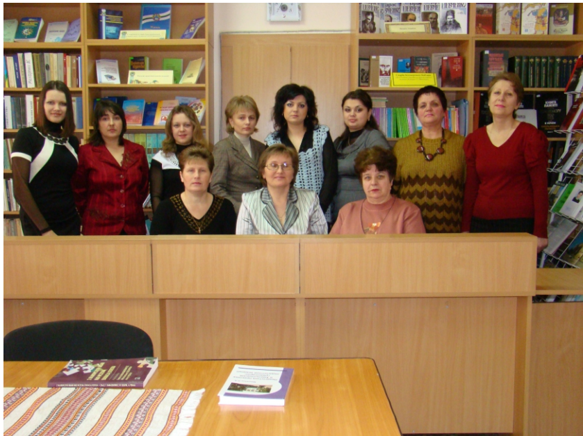
З колегами. 2009 р.