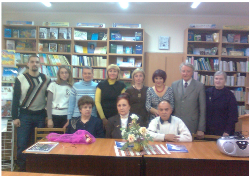
Презентація літературного альманаху «Музика душі». 2011 р.