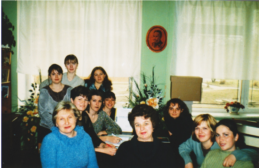
Зі студентами в читальному залі бібліотеки 2002 р.