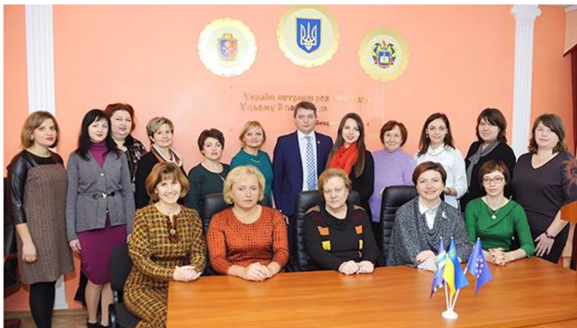
Кафедра педагогіки Хмельницької гуманітарно-педагогічної академії