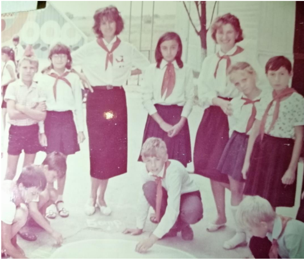
Практика в піонерському таборі «Глобус» Одеської області (1988 р.)