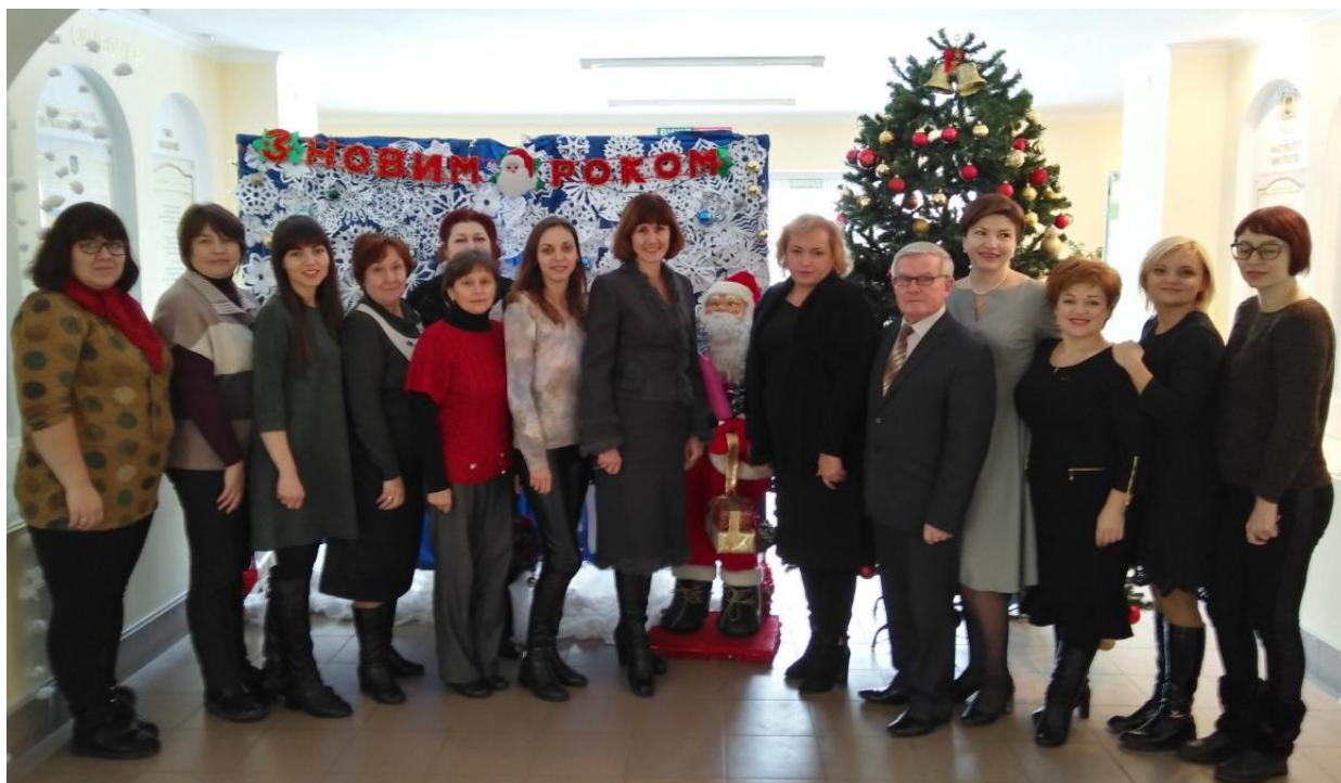
Кафедра педагогіки напередодні Нового 2019 року