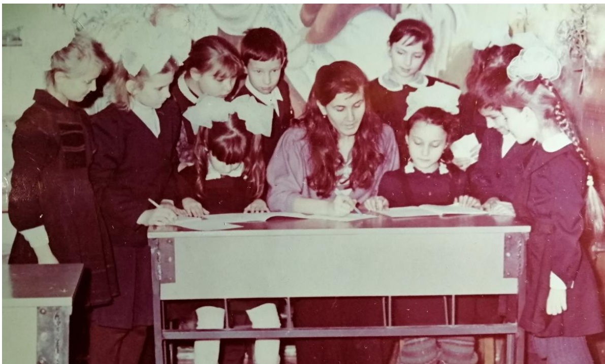
Другий рік професійної діяльності в Шепетівській школі № 1 ім. М. Островського. 4-А клас. Творчий гурток (1992 р.)