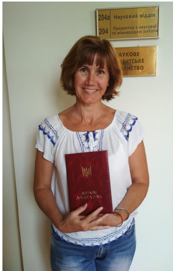
Отримання диплома доктора педагогічних наук (2018 р.)