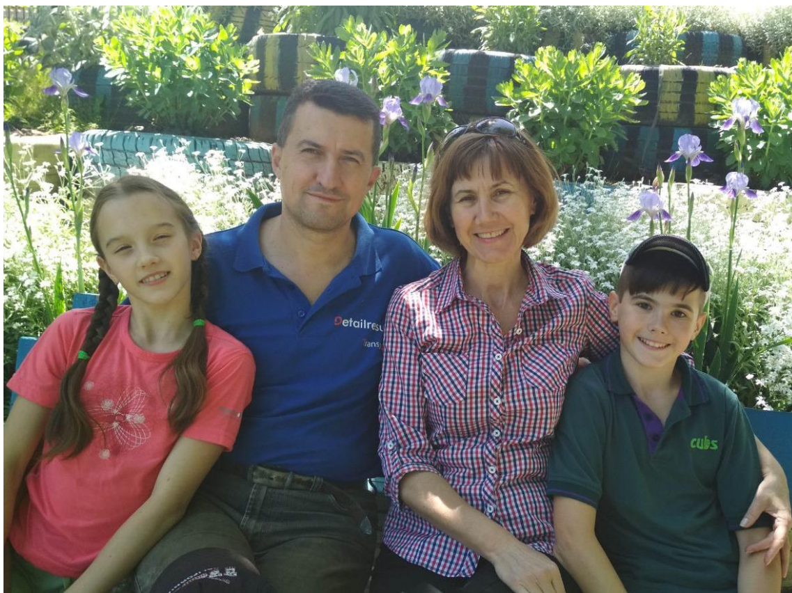
Літній відпочинок на дачі (2016 р.)