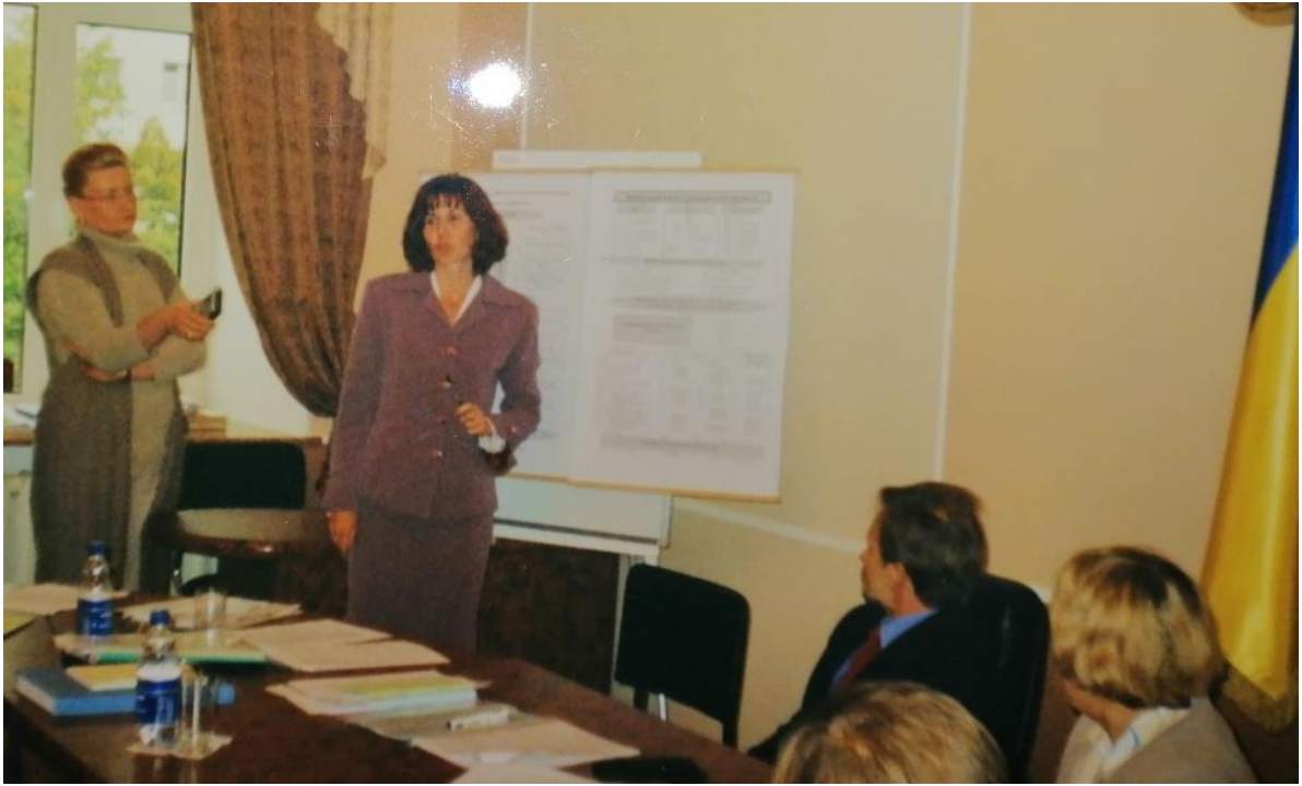
Захист кандидатської дисертації на засіданні спеціалізованої вченої ради ЖДУ ім І. Франка (2004 р.)