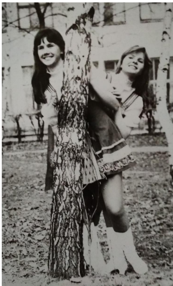
В шкільні роки улюбленим заняттям були народні танці