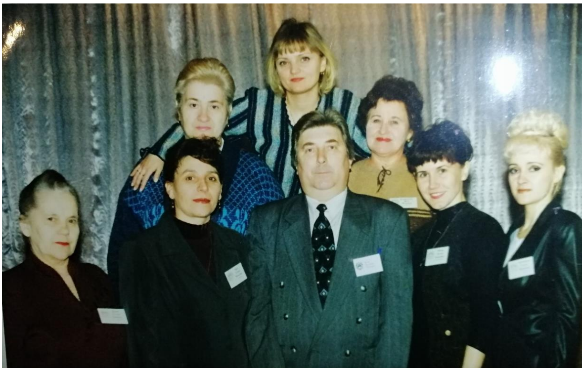
Циклова комісія з педагогіки та психології Хмельницького педагогічного коледжу (1999 р.)