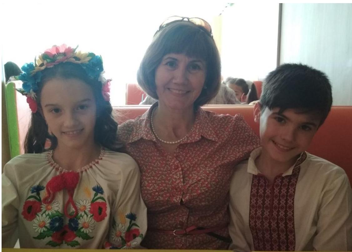
Святкування успішного закінчення дітьми п'ятого класу гімназії (2018 р.)