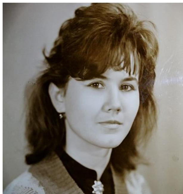
Вгорі, зліва: першокурсниця ІДПІ, 17 років (1986 р.), Знизу, зліва: студентка 2 курсу ІДПІ, 18 років (1987 р.), Вгорі, справа: перший день професійної діяльності, вчителька 3-А класу Шепетівської середньої школи № 1 ім. М. Островського (1990 р.). Знизу, справа: випускниця ЖДПІ ім. І. Франка (1990 р.)