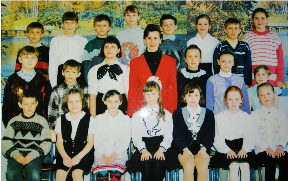
Останній рік роботи у початковій школі. 4-Б клас. Хмельницька спеціалізована школа № 30 з поглибленим вивченням іноземних мов (1996 р.)