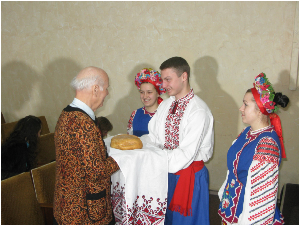
На фото: студенти Хмельницької гуманітарно-педагогічної академії гостинно зустрічають Ш.О.Амонашвілі у стінах альма-матері