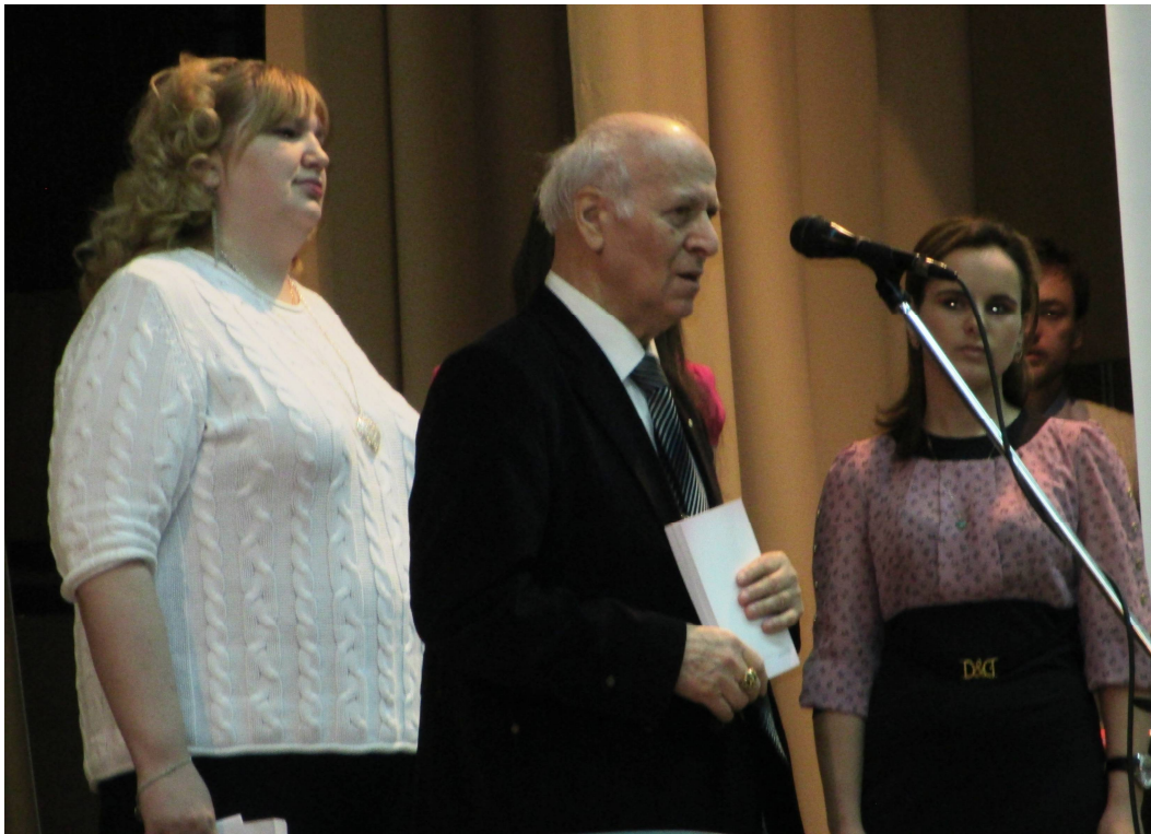
На фото: Ш.О.Амонашвілі оголошує результати конкурсу студентських творів на тему “Як світлий ангел перемагає”