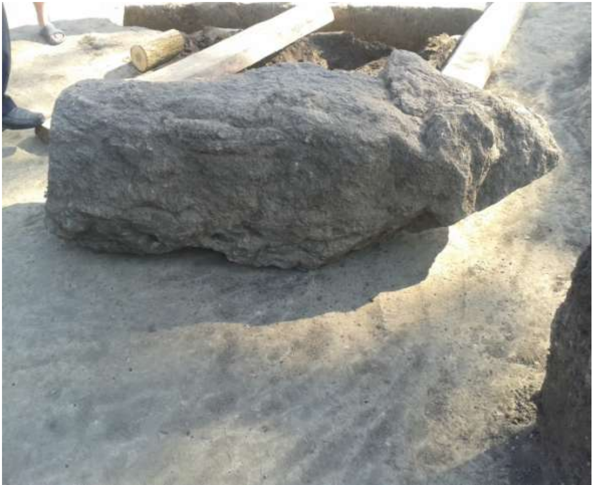
Рис. 2. Кам'яний антропоморф на Губинському городищі.