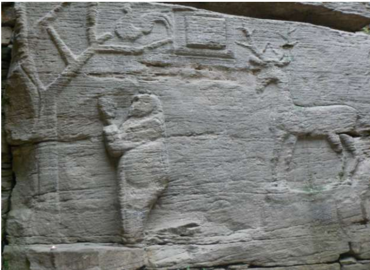
Рис. 2. Рельєфне зображення на стіні скельного язичницького храму в с. Буша

Її скомпоновано на відстані 1,2–1,3 м від основи скельного приміщення. Ніша використовувалася для язичницьких жертвоприношень. У неї також могли ставити жертвну їжу та питво в посуді [9, с.125–126].