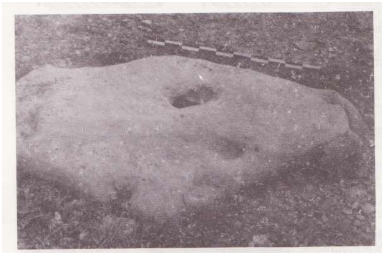
Рис. 3. Жертовна кам'яна плита із с. Чабанівка

Поклоніння необробленому камінню або такому, яке мало на поверхні звичайні та штучні заглиблення, примітивні зображення, було притаманне багатьом народам з давньою історією. Особливо широко культ каміння був розповсюджений у Скандинавії, країнах Прибалтики, Білорусі, північних областях Росії та на півдні України. З камінням пов'язано багато легенд, у яких йому надавалося цілющої сили [4, с.12–14].