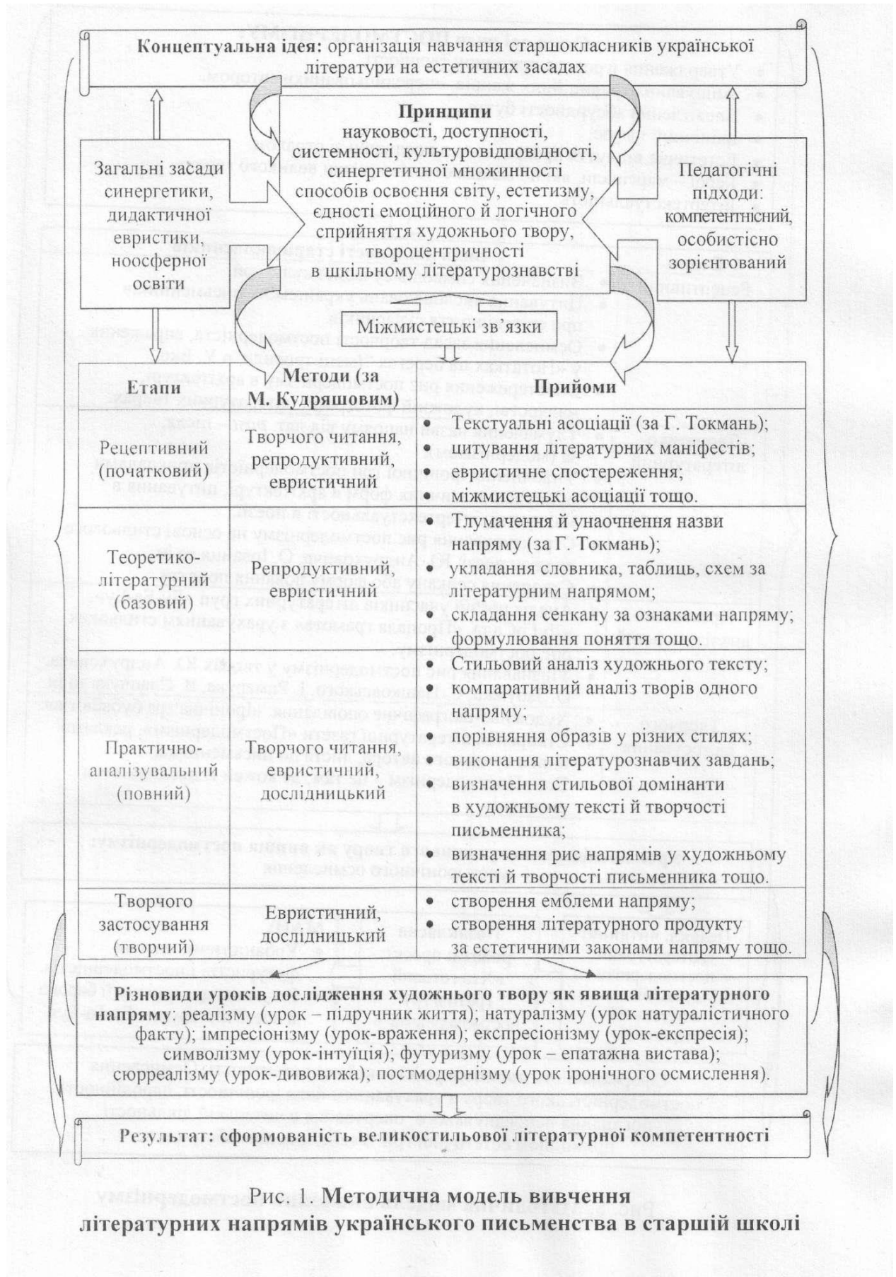
Рис. 1. Методична модель вивчення літературних напрямів українського письменства в старшій школі