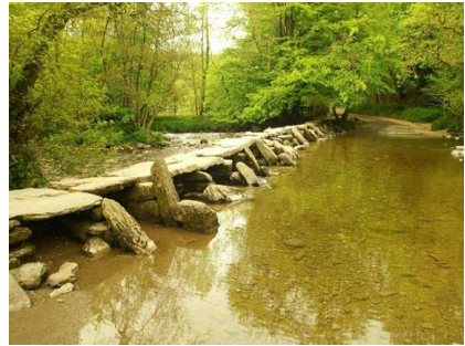
Рис. 2. Міст «Тарр Степс» в Англії

Мульвійв міст це один з найдавніших романтичних мостів світу (рис.3). Знаходиться в Італії побудований в 109 р. до н.е. з каменю [3]. Завдяки таким мостам світ вважає, що римські мости виглядають як справжні шедеври. Коли було видано роман «Три метри над небом» (Федеріко Моччіа) міст перетворився на паломництво закоханих та найцікавішим об'єктом для відвідування туристів. Тому якщо ви любитель справжньої романтики, обов'язково відвідайте це місце.