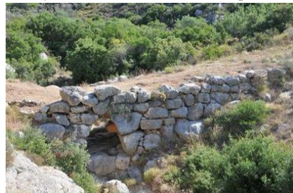
Рис. 1. Міст «Аркадіо» в Греції

Конкурентом мосту «Аркадіо» за титул найдавнішого є міст «Тарр Степс» (Рис.2), який знаходиться в парку Ексмур (Англія) [2]. Точність його будівництва не відома, хтось вважає що це 3000 р. до н.е., ще хтось що в 1400 р. до н.е.. Міст має висоту 1 метр, а довжина 55 метрів. Були випадки коли під час сильних злив річковий потік зносив брили і тоді доводилось повертати їх на місце. Тому цей міст є досить небезпечним і його радять відвідувати тільки в сприятливих умовах. Місцеві легенди говорять що міст побудував сам Диявол, який поклався вбити всіх хто перейде цей міст. Тому він досить популярний серед туристів і всі хочуть перейти через нього, щоб довести що легенда не правдива.