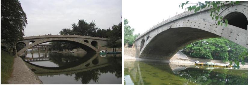
Рис. 5 Міст «Аньци» в Китаї

Найбільш міцним мостом свого часу є міст «Аньци» який знаходиться в Китаї та був побудований в 605 році (Рис. 5). Це найдавніший міст з відкритими перемичками. Тримається він лише на двох опорах, в довжину має аж 50 метрів то 9 метрів ширини. Спеціальна конструкція дозволила не тільки зменшити вагу моста, а й зробити його більш стійким. За всю свою історію міст витримав вісім війн, десять повеней і землетруси найсильніший з них був шкалою 7,2 бали [4]. Тому цей міст можна вважати «сталевим». Можливо скоро ми побачим цей міст включеним до пам'ятників Всесвітньої спадщини. Це охопить ще більшу частину туристів. Але популярний цей міст тільки серед жителів Китаю.