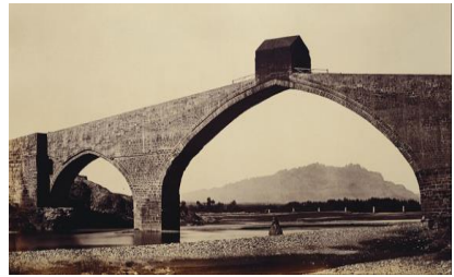
Рис. 6 Диявольський міст в Іспанії

Міст «Капельбрюкке» (1333 р.) в Швейцарії вважається найстарішим дерев'яним мостом (Рис. 7). Міст був оздоблений 158 картинами на тему історії Швейцарії, але спалахнула пожежа, вдалось реконструювати лише 30 картин. Багато людей проїжджають цей міст тому що він з'єднує старе місто з новими кварталами. Тому більшість екскурсій включають проїзд через нього [5].