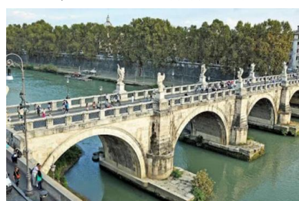
Рис. 3. Мульвійв міст в Італії

Алькантарський міст знаходить в Іспанії, збудований в 106 році (Рис. 4). Він занесений до культурної спадщини Іспанії, але досі використовується як для пішого так і автомобільного переходу через річку. Деякі екскурсоводи кажуть, що на мості є написи самого імператора, про те що цей міст буде стояти вічно. Але під час війни міст неодноразово отримував пошкоджень, хоча повністю його зруйнувати не вдалось. Цей міст входить до багатьох часто туристичних маршрутів та є їхньою родзинкою.