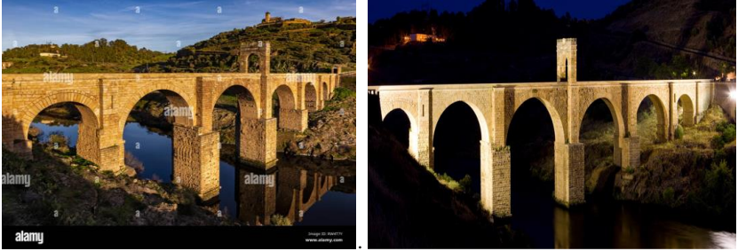
Рис. 4 Алькантарський міст в Іспанії

Найбільш міцним мостом свого часу є міст «Аньци» який знаходиться в Китаї та був побудований в 605 році (Рис. 5). Це найдавніший міст з відкритими перемичками. Тримається він лише на двох опорах, в довжину має аж 50 метрів то 9 метрів ширини. Спеціальна конструкція дозволила не тільки зменшити вагу моста, а й зробити його більш стійким. За всю свою історію міст витримав вісім війн, десять повеней і землетруси найсильніший з них був шкалою 7,2 бали [4]. Тому цей міст можна вважати «сталевим». Можливо скоро ми побачим цей міст включеним до пам'ятників Всесвітньої спадщини. Це охопить ще більшу частину туристів. Але популярний цей міст тільки серед жителів Китаю.